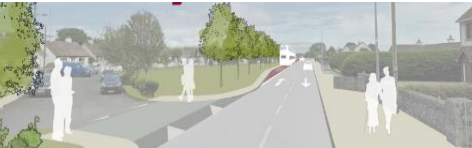
Fíor 1 – Léiriú 3T ar Chorrán Bhaile an Bhriota

Tá an obair á chur i gcrích ag Jons Civil Engineering agus is iad DBFL na hInnealtóirí Comhairleacha don tionscadal. Tá an tionscadal á chur i gcrích thar ceann Chomhairle Cathrach na Gaillimhe agus tá sé maoinithe ag an Udarás Náisiúnta Iompair. Tuigeann na páirtithe ar fad atá luaite leis go gcuirfidh na obair isteach ar an gceantar. Tá muid fóirbhúioch as bhur gcuid foighne agus ba mhaith linn leithscéal a ghabháil dá bharr.